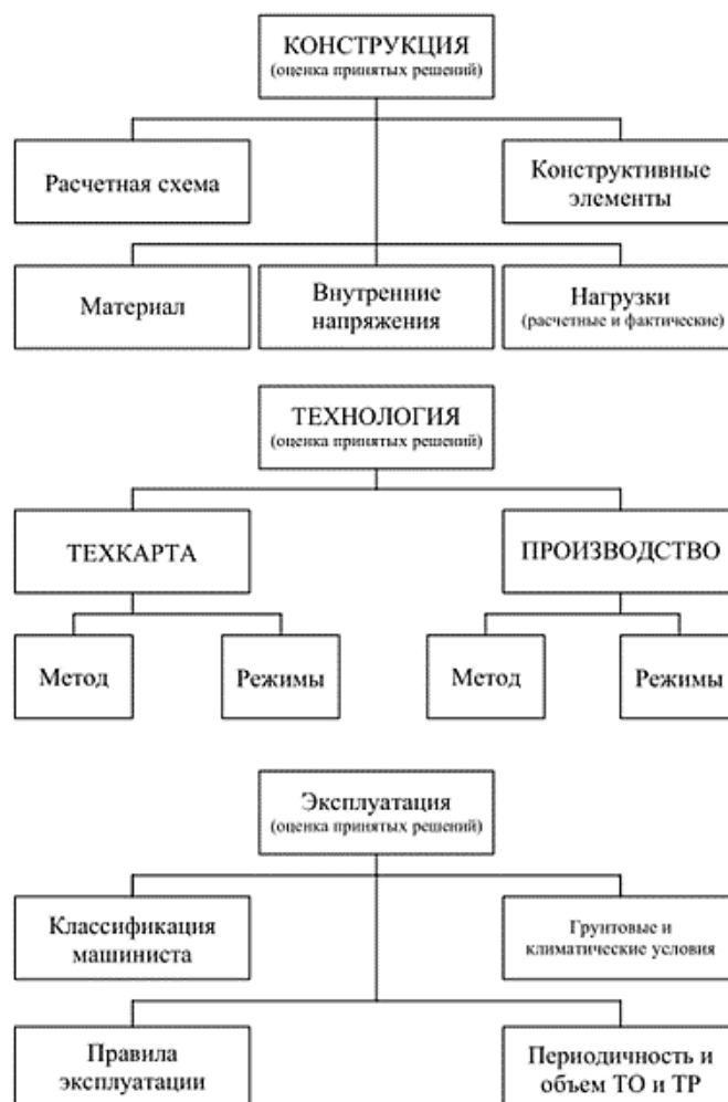
Рис. 3. Структура комплексного анализа входных факторов детали

Разработан метод комплексного анализа входных факторов (рис. 3), а для условий серийного и массового производства — общий комплекс рекомендаций по увеличению ресурса детали [7, 8].