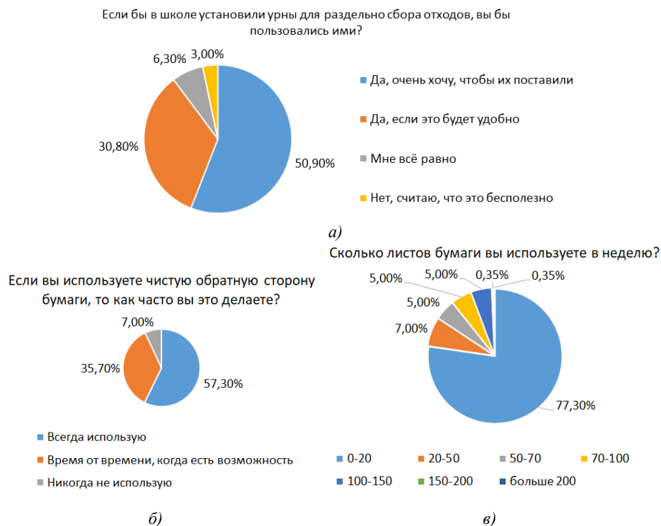
Рис. 1. Результаты диагностики представителей школьного сообщества

Результаты статистической обработки данных диагностики представителей школьного сообщества приведены на рис. 1.