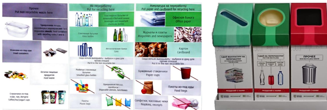
Рис. 3. Примеры дизайн-решений для средств наглядной агитации

В марте-апреле 2019 года разработаны дизайн-решения, изготовлены и размещены на территории школы средства наглядной агитации, способствующие продвижению проекта (рис. 3).